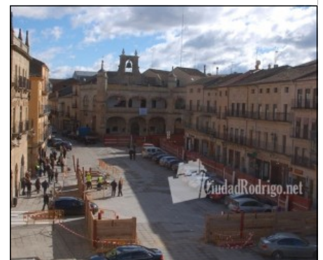
Montaje de la Plaza de Toros del Carnaval del Toro 2015, Ciudad Rodrigo